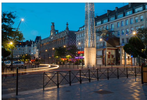
Mis à jour le 1 er juin 2015

Inscription obligatoire au 069/88.07.62 ou info@ciep-ho.be